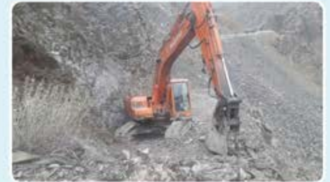
۱۱ / غبرگولي / ۱۳۹۹

په خوست ولايت کې د کليو د بيا رغونې او پراختيا وزارت د سيمه ييز پروگرام له لوري د سرک جوړولو د پروژې کار ۸۰ سلنه مخ ته تللی دی.