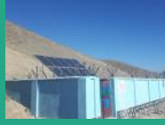
په ميرزکې ولسوالۍ کې د اوبو رسولو يوه لمريزه شبکه کې اخیستني ته وسپارل شوه ...