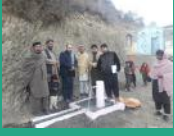
په حاجي آريوب ولسوالۍ کې ۲۷۰ کورنيو ته د څښلو پاکی اوبه برابرې شوې ...