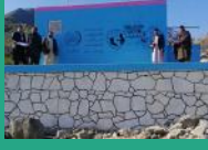
په کونړ ولايت کې د اوبو رسولو يوه شبکه کې اخیستني ته وسپارل شوه ...