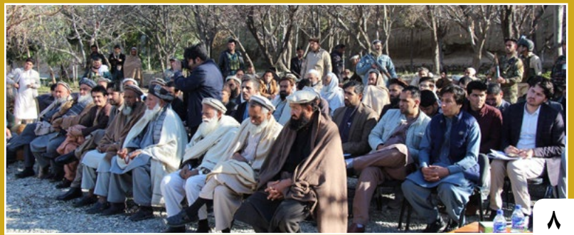
برگزاری ورکشاپ احیای کاربها در افغانستان