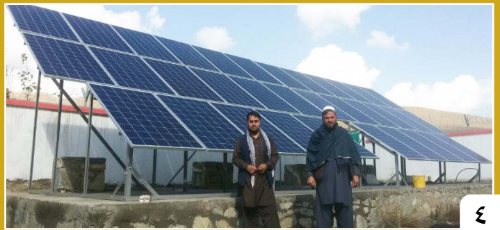
تکمیل کار بازسازی دو کاریز در ولسوالی‌های جلریز و سیدآباد ولایت میدان وردگ